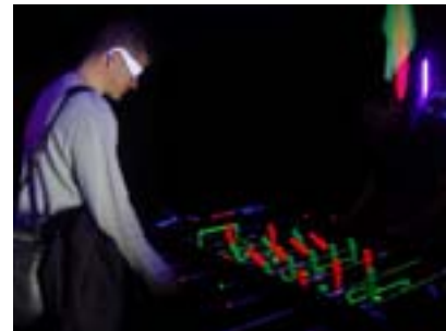
Kickern in der Blackbox

Zwei Tische zum Fühlen, an denen der Unterschied als Sehende und Sehbehinderte verdeutlicht wurden sowie Säckchen mit verschiedenen bekannten und unbekanntem Objekten vervollständigten den Parcours der Sinne.