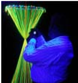
Objekte in der Blackbox